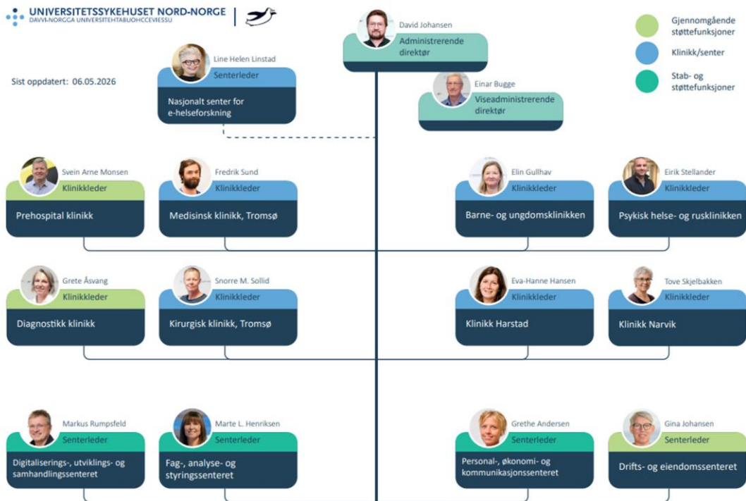
Organisasjonskart Universitetssykehuset Nord-Norge HF.

UNN ledes av et styre og har en administrasjon lokalisert i Tromsø. I 2025 hadde UNN 7 372 årsverk fordelt på 9 246 ansatte.