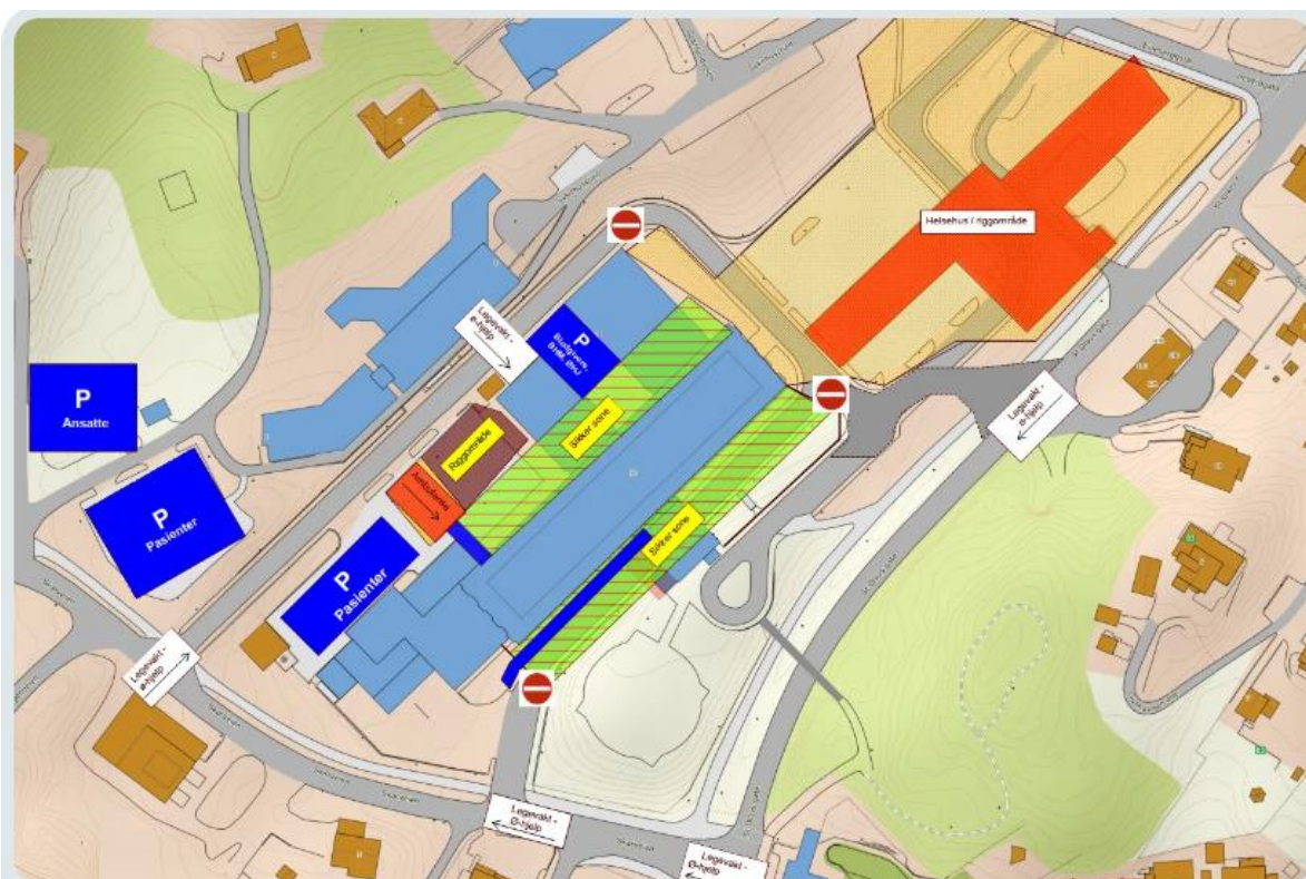
Oversikt over Harstad