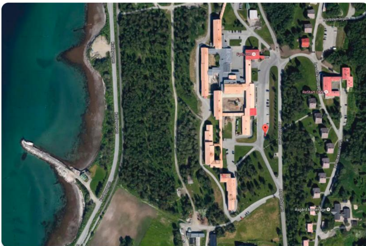
Kart over området til UNN Åsgård